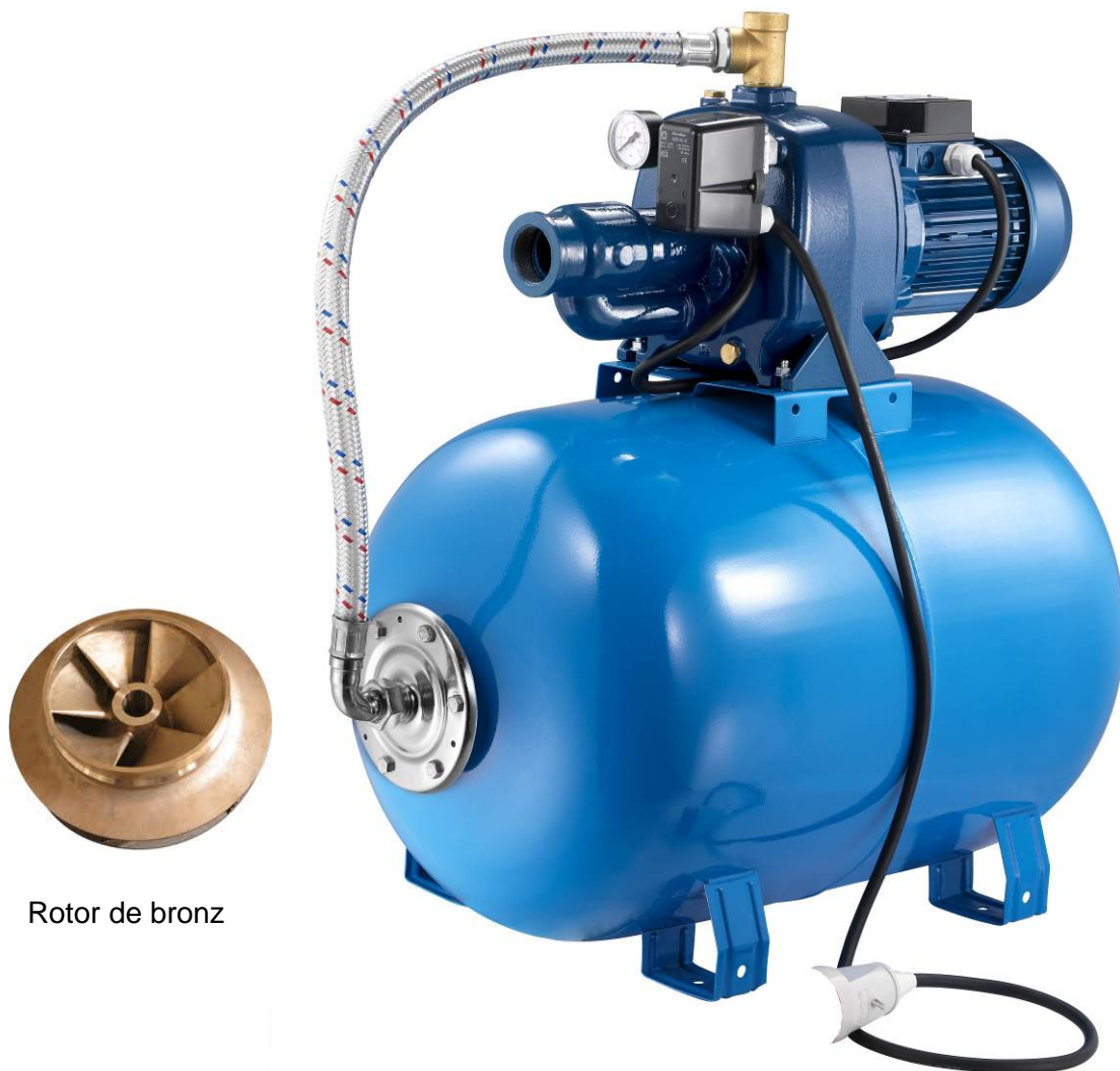
Rotor de bronz